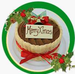
X'mas Tiramisu Camadas de pão de ló especial em calda de café e licor, alternadas com mousse leve de queijo