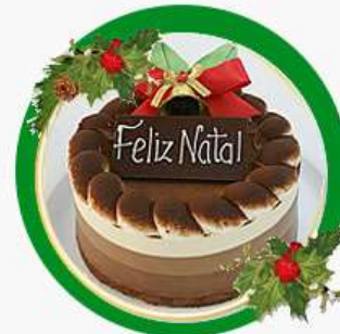
X'mas Tricolori Bolo de chocolate e camadas de mousses de chocolate meio amargo, ao leite e branco