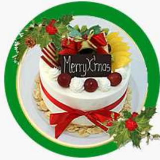
X'mas Fruits Paradis Bolo branco, custard cream, chantilly e frutas