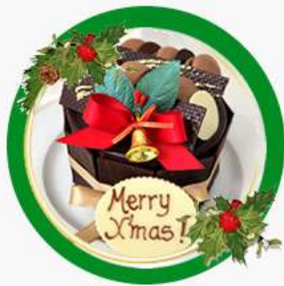
X'mas Chocolat Bolo de chocolate, mousse de chocolate amargo e mousse de chocolate branco com praliné de avelãs