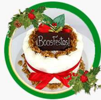
X'mas Coco Noix Bolo branco, creme de nozes e creme de coco com nozes