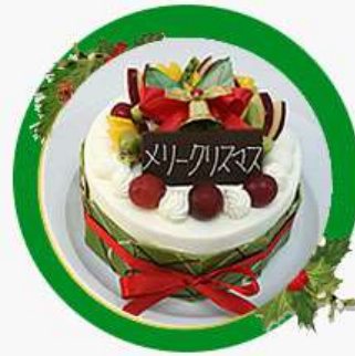
X'mas Matchá Bolo de matchá, chantilly e frutas